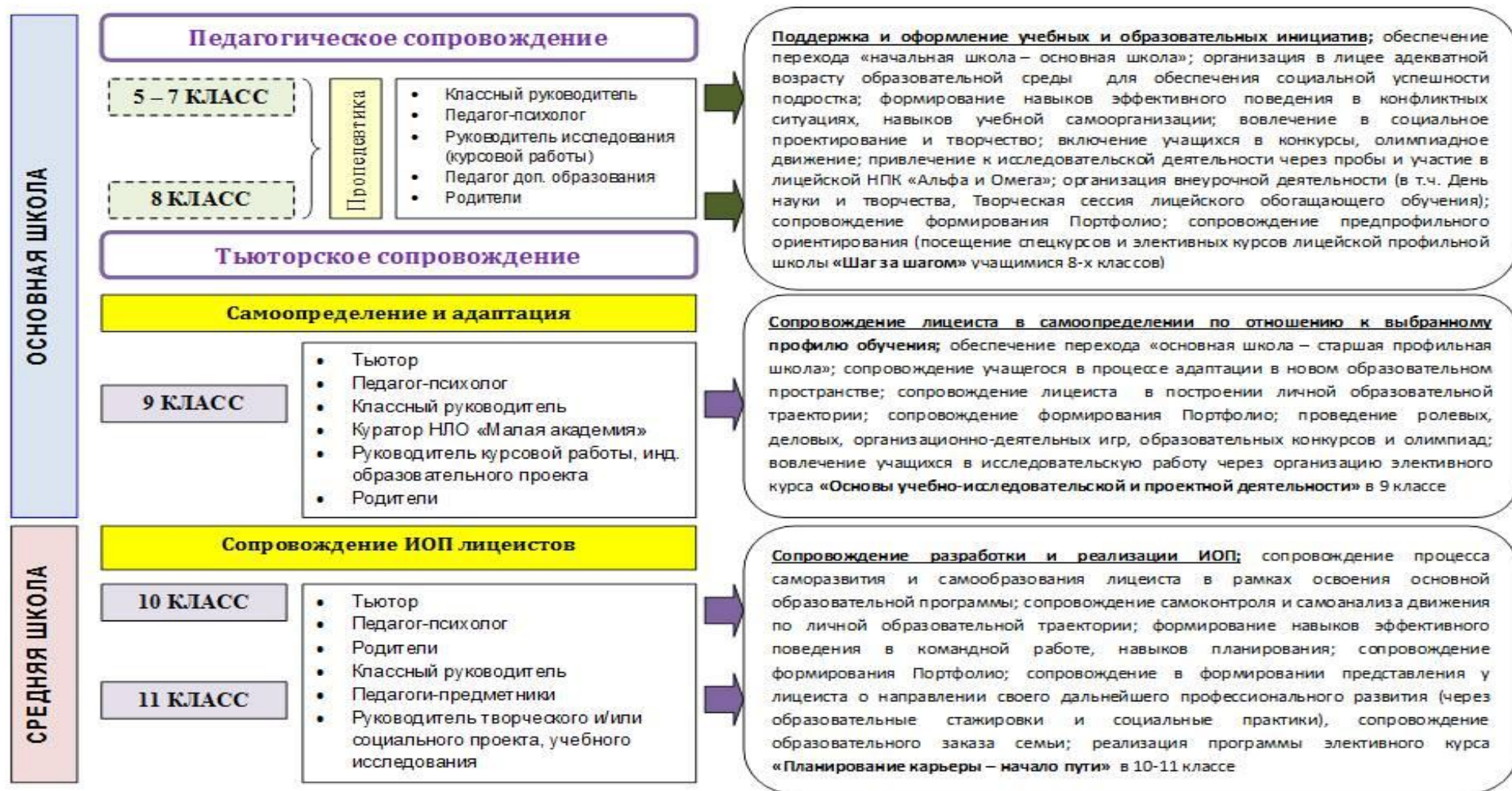
Рис. 3. Модель тьюторского сопровождения индивидуальных образовательных программ лицейстов